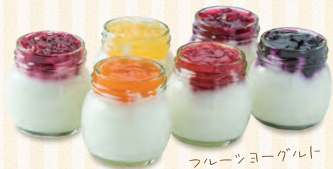
フルーツヨーグルト