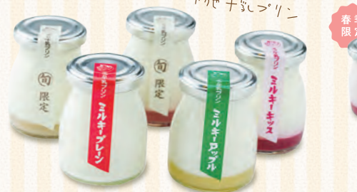
小布施牛乳プリン

「小布施」生まれの こだわりスイーツ。 地元の食材と新鮮なフルーツを ふんだんに使用した、こだわりのスイーツ