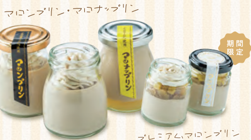
マロンプリン・マロンアップリン